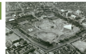
昭和30年代後半の駿府公園周辺

戦後、都市公園として整備された駿府城。市民の憩いの場となり、発掘調査も進められています。これまでの歩みを振り返り、駿府城の未来を思い描いてみましょう。